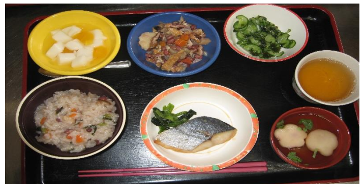
行事食 小正月・小豆粥と煮ごめ