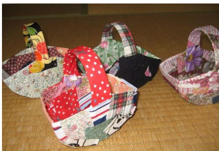
牛乳パックと端切れで